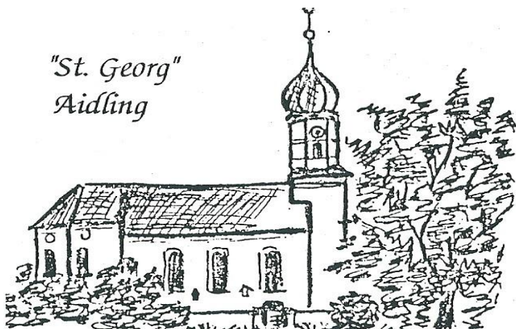
"St. Georg" Aidling