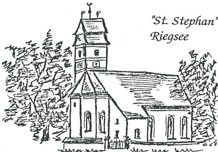
"St. Stephan" Riegsee