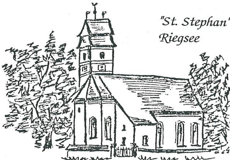
"St. Stephan" Riegsee